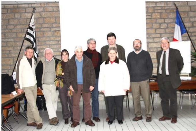
Les délégués de Malansac et St Gravé

L'agrandissement du périmètre : deux nouvelles communes Malansac et Saint-Gravé